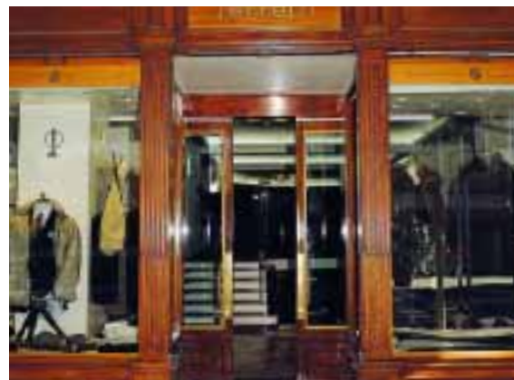
Automatiktür mit Holzflügeln am Eingang einer Boutique