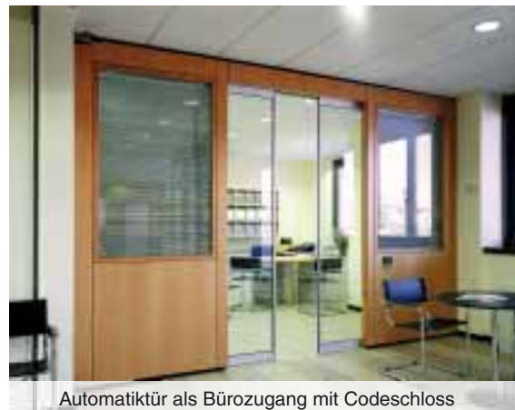
Automatiktür als Bürozugang mit Codeschloss