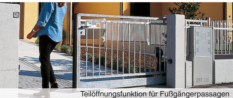
Teilöffnungsfunktion für Fußgängerpassagen